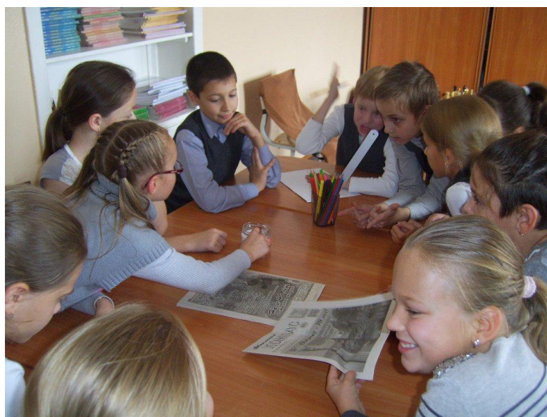
Бурные дискуссии, на тему сбережения природных ресурсов